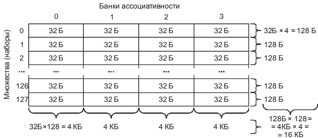
Рис. 1. Пример множественно-ассоциативной кэш-памяти

Чтобы адреса отображались на одно и то же множество в кэш-памяти, необходимо, чтобы смещение между ними было кратно размеру банка кэш-памяти. Так как размер банка кэш-памяти не всегда известен, то рассмотрим, как его можно оценить. Размер кэш-памяти кратен размеру банка, поэтому, если известен размер кэш-памяти, то расстояние между началами фрагментов можно взять равным ему. Если же размер кэш-памяти неизвестен, то можно использовать тот факт, что размеры банков кэш-памяти практически всегда являются степенью двойки. Для современных процессоров подходящим смещением между фрагментами будет 2^{24} \text{ Б} = 16 \text{ МБ} .